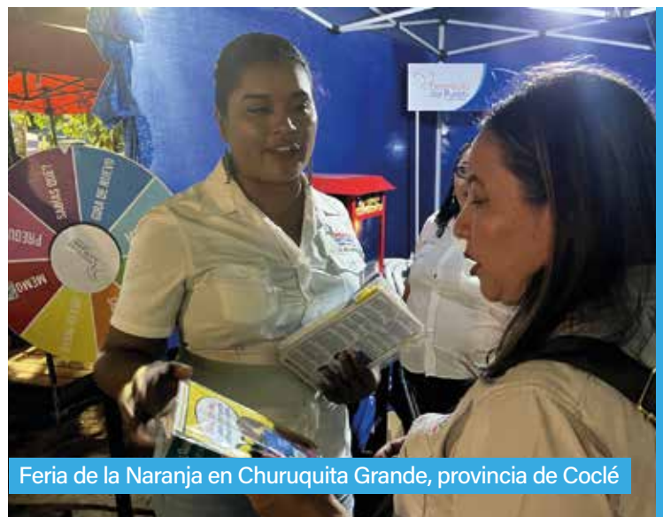
Feria de la Naranja en Churuquita Grande, provincia de Coclé