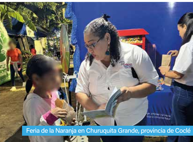
Feria de la Naranja en Churuquita Grande, provincia de Coclé

La Institución Nacional de Derechos Humanos (INDH), destacó la importancia de estos espacios feriales, especialmente en áreas rurales, donde el acceso a información y orientación puede ser limitado.