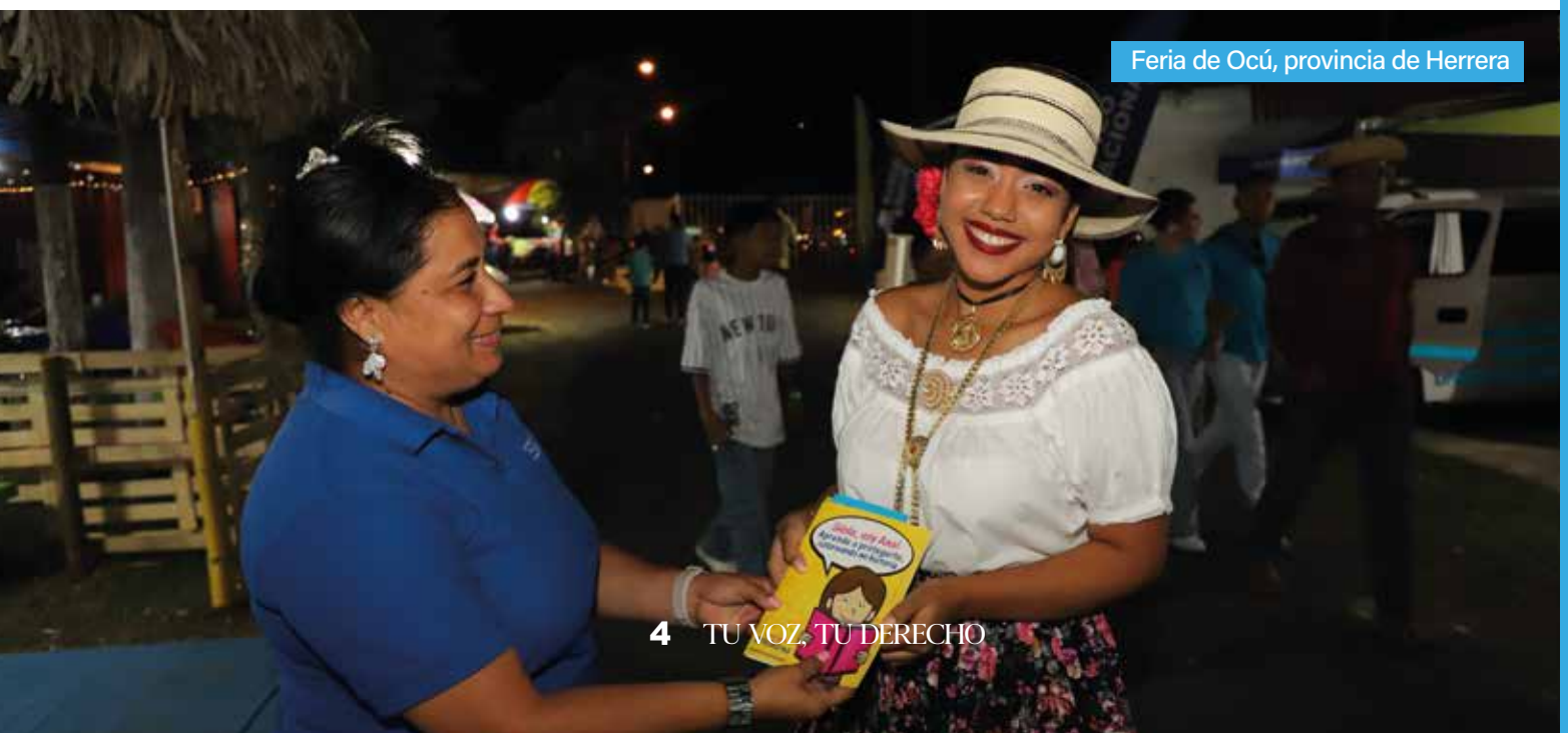
Feria de Ocú, provincia de Herrera