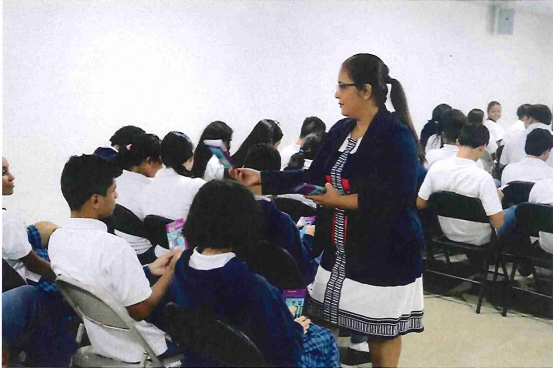
24 de septiembre de 2025, charla: Colegio Parroquial San Judas Tadeo