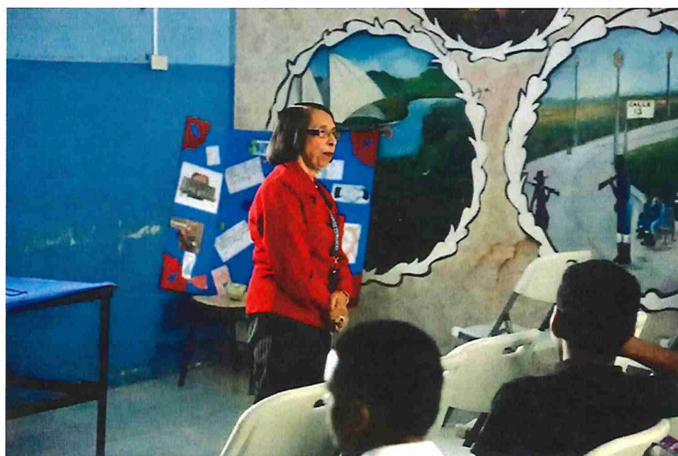
03 de octubre de 2025, charla: I.P.T. de Don Bosco