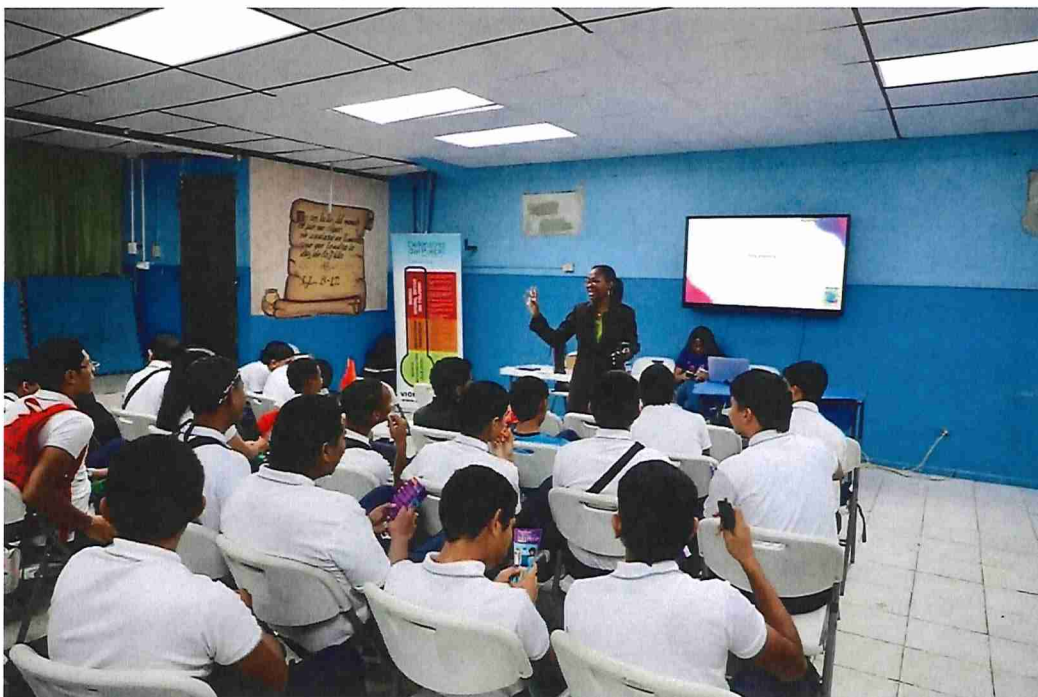
03 de octubre de 2025, charla: I.P.T. de Don Bosco