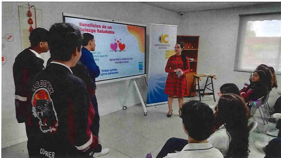
Gráfico: Defensoría del Pueblo de la República de Panamá • Fuente: Centro de Estadísticas, Ministerio Público de Panamá/ Unidades de Homicidios Ministerio Público • Creado con Datawrapper

11 de agosto de 2025, charla – Instituto Bilingüe Cultural