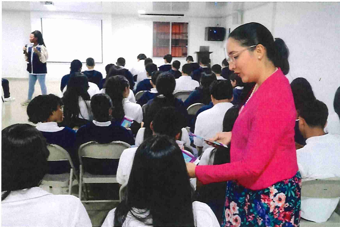
24 de septiembre de 2025, charla: Colegio Parroquial San Judas Tadeo