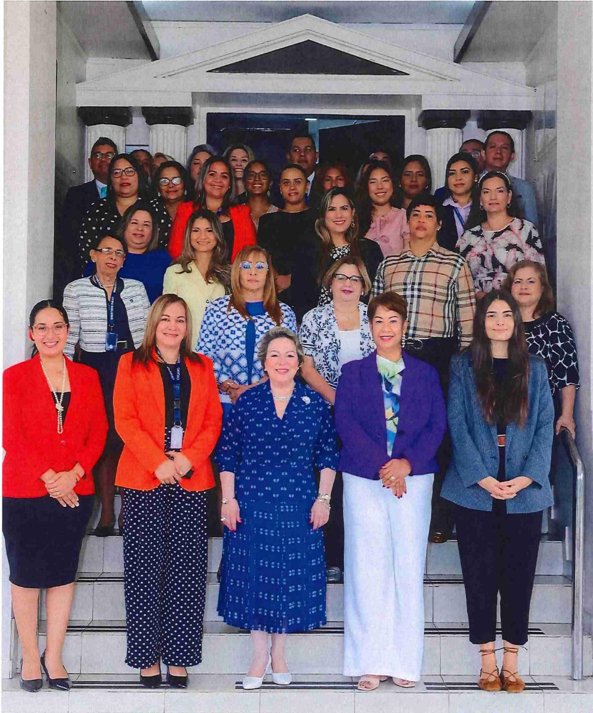
25 de junio de 2025, capacitación - “Recomendaciones al Estado panameño sobre aplicación de convenios y tratados internacionales realizadas por los comités de protección de los derechos humanos”