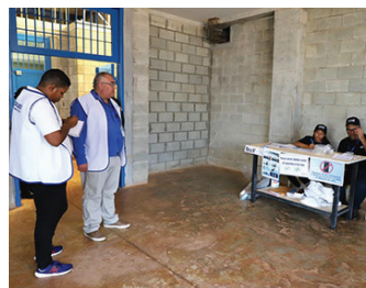
La Defensoría del Pueblo, en su papel de observador de las elecciones, realizó visitas a centros penitenciarios a nivel nacional para garantizar un proceso electoral justo y transparente.