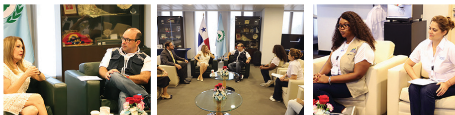
El Defensor del Pueblo, Eduardo Leblanc González, sostuvo una reunión con Nivia Castellón, presidenta de Junta Nacional de Escrutinio. En el encuentro, que contó con la presencia de las observadoras internacionales de las Defensorías Paraguay y Costa Rica; se abordaron las diversas incidencias ocurridas en algunos de los centros de votación a nivel nacional.